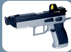
STS auf Verschluss montiert / mounted on slide