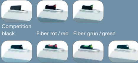
Competition black Fiber rot / red Fiber grün / green Standard black Fiber rot / red Fiber grün / green white dot